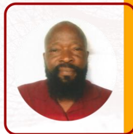
رئيس قسم المحاسبة