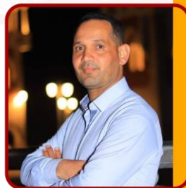
رئيس قسم التمويل والمصارف