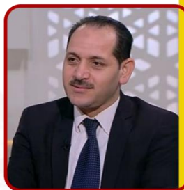
رئيس قسم العلاقات الاقتصادية الدولية