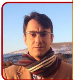
رئيس قسم العلوم الاقتصادية الدولية