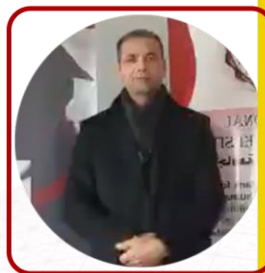
رئيس قسم إدارة الأعمال والتسويق